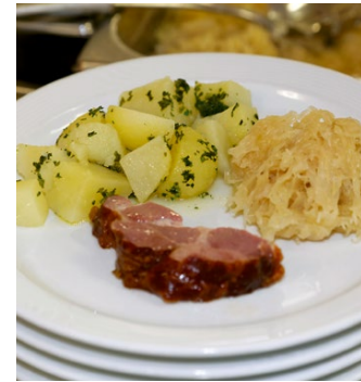
Mittagessen aus der Küche des Seniorenzentrums. Früchteteller als Zwischenverpflegung.